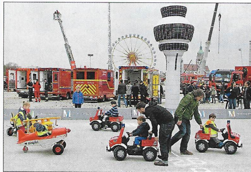
Für jede Altersstufe: Jede Menge Spaß und Spiel hatten auch die Kleinsten.