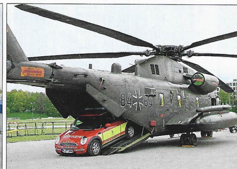
Auch zu sehen: Sikorsky (zu Lockheed Martin) CH – 53 GS, der sogar einen Mini One D transportieren kann.

Für die „Kids“ und Jugendlichen waren jede Menge Aktions- sowie Spaß- und Spielmöglichkeiten geboten. Dazu gehörten eine Erlebniswelt, Kindermitmachprogramm (von etwa 20 Organisationen), Gitterlabyrinth der Mobilien Atemschutzübungsstrecke (Sattelzug) der Münchner Feuerwehr, Hüpfburg und vieles andere mehr. Also rundherum eine gelungene Sache und von den Kindern und Jugendlichen begeistert und gerne angenommen.