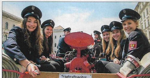
Hab mein Wage voll gelade: Der Tragkraftspritzenanhänger der FF Reithofen-Harthofen (Baujahr 1938) wurde von einem Traktor gezogen.