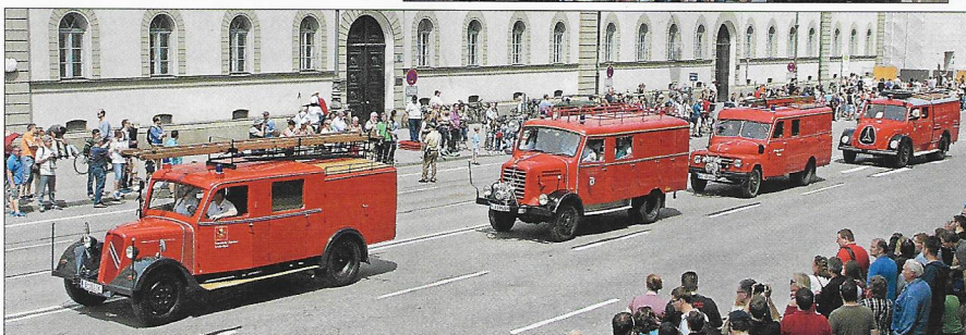
Vielfalt: Ob Citroën 23 R aus dem Jahr 1952 (Feuerwehr-Oldtimerverein Hard, Österreich), Borgward, Hanomag oder Magirus – so ziemlich alle Fahrzeugmarken waren vertreten.