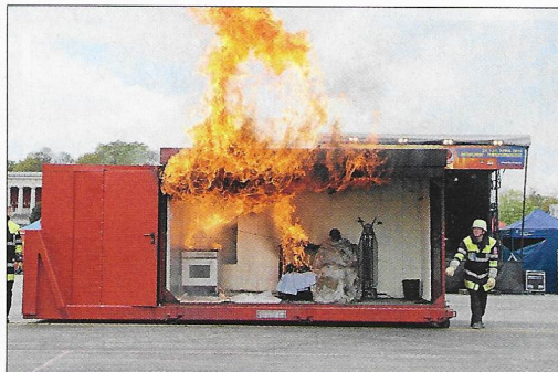
Brandschutzaufklärung: Dazu gehörte auch die Demonstration von Brandgefahren im Haushalt.