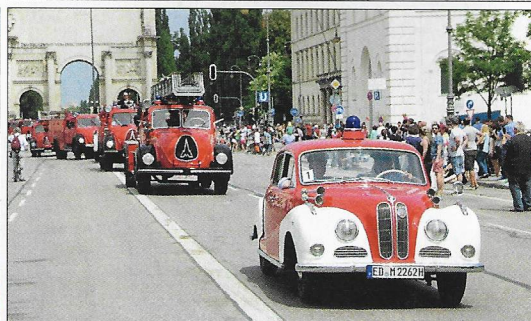
1950er-Jahre: Der alte BMW führt die Magirus-Rundhauber seiner Zeit an.