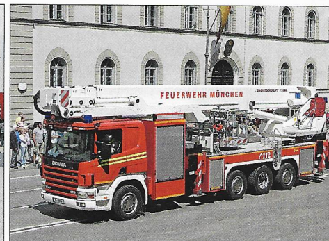
Hoch hinaus: Die Hubrettungsbühne mit 53 m Arbeitshöhe der Berufsfeuerwehr München.