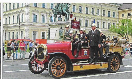
Magirus-Autospritze: Sie stammt aus dem Jahr 1926 und gehört der FF Pfaffenhofen an der Ilm (Obb.).