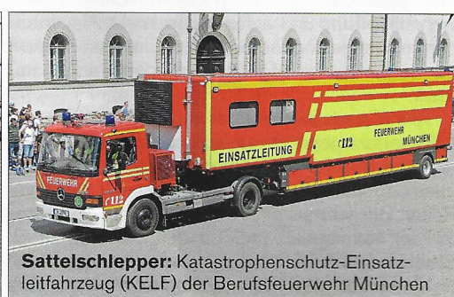
Sattelschlepper: Katastrophenschutz-Einsatzleitfahrzeug (KELF) der Berufsfeuerwehr München

Württemberg oder sogar aus Österreich gekommen waren.