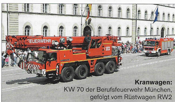
Kranwagen: KW 70 der Berufsfeuerwehr München, gefolgt vom Rüstwagen RW2