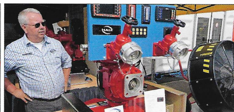
MESSE RETTMOBIL Neue Ausrüstungen und Produkte S. 36