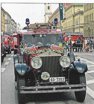
Rolls Royce: Phantom II (Jahrgang 1930) zum Feuerwehrfahrzeug 1940 umgebaut. Im Einsatz bei der Feuerwehr Lenzburg in der Schweiz bis 1961. Heute Feuerwehrverein Gofli Lenzburg.