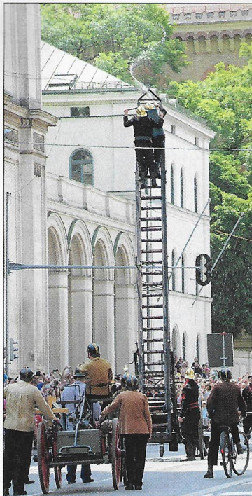
Balanceleiter und Rucksackspritze: Unterwegs wurde ein Löscheinsatz gezeigt.