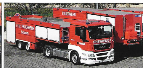
SATTELAUFLIEGER Neuheiten im Vergleich mit Wechselladern S. 40