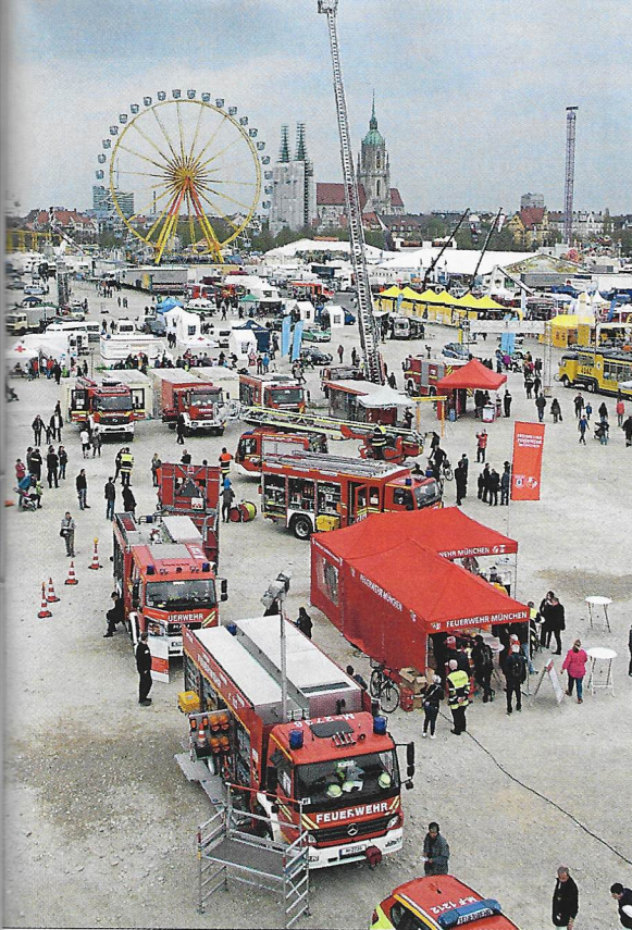
Aktionstage: An zwei Tagen präsentierten sich die Feuerwehr und die Rettungsdienst- und Einsatzorganisationen auf der Theresienwiese.