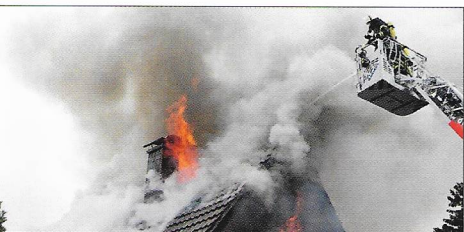
RAUCHGASVERGIFTUNG Ehepaar stirbt bei Wohnhausbrand S. 32